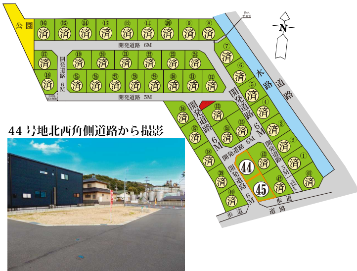
44号地北西角側道路から撮影