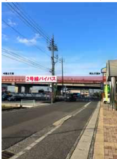
現地駐車場から北に向かって撮影